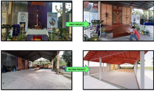
MONTFORT MISSIONARIES COVERED-COURT-TURNED-PLACE-OF-WORSHIP

Al principio, solo teníamos algunas personas que venían a la Santa Misa. Se celebraba dentro de nuestra pequeña capilla comunitaria. Pero como las personas que venían a la Eucaristía llegaron a unos cientos, tuvimos que utilizar nuestro gran terreno de baloncesto cubierto.