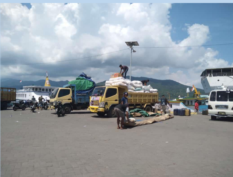
La travesía en barco desde Larantuka, ciudad a la punta Este de la isla de Flores, hasta Adonara, luego a Lembata.