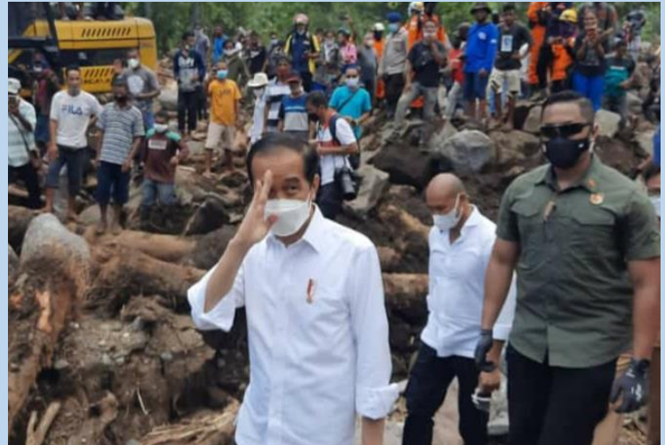
El presidente del país, Sr. Joko Widodo

Hasta ahora, los residentes, de repente convertidos en refugiados, necesitan todavía ayuda. Lo más urgente es el acompañamiento psicológico de los residentes para que puedan asimilar esta experiencia traumática. No podemos olvidar la posibilidad de una ayuda para la reconstrucción de las casas y de los equipamientos sociales (carreteras, electricidad, agua) y públicos (escuelas e infraestructuras de salud) como base de futuro. ■