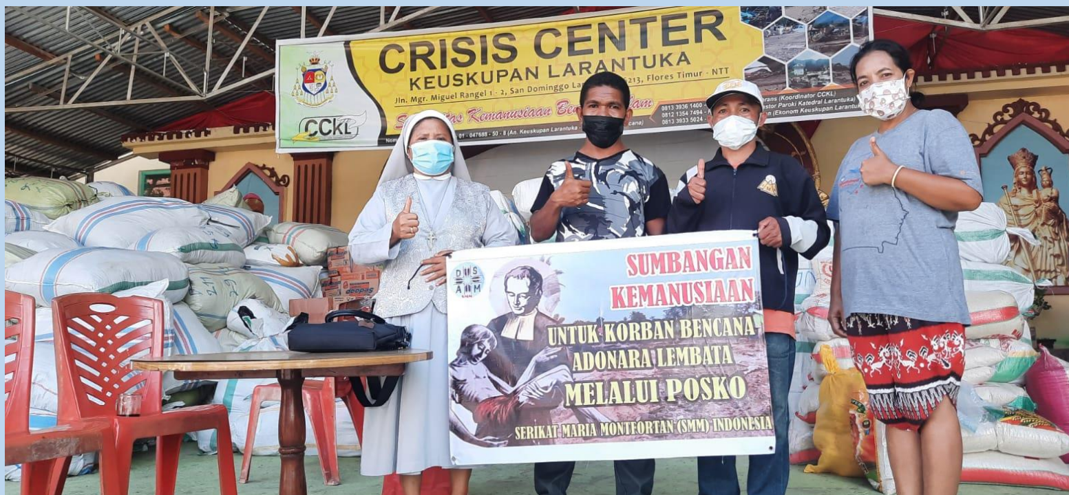
Centro de coordinación de la ayuda proporcionada por la diócesis de Larantuka.