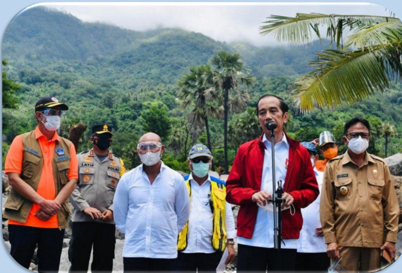
El presidente Jokowi ha visto con sus propios ojos las víctimas de las crecidas “relámpago” en Lembata y Adonara.