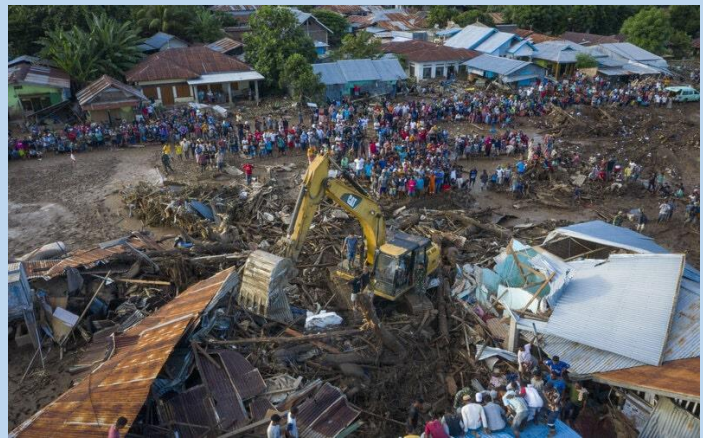
Diversas fotos de los daños causados por el ciclón “Seroja”, el 4 de abril 2021.