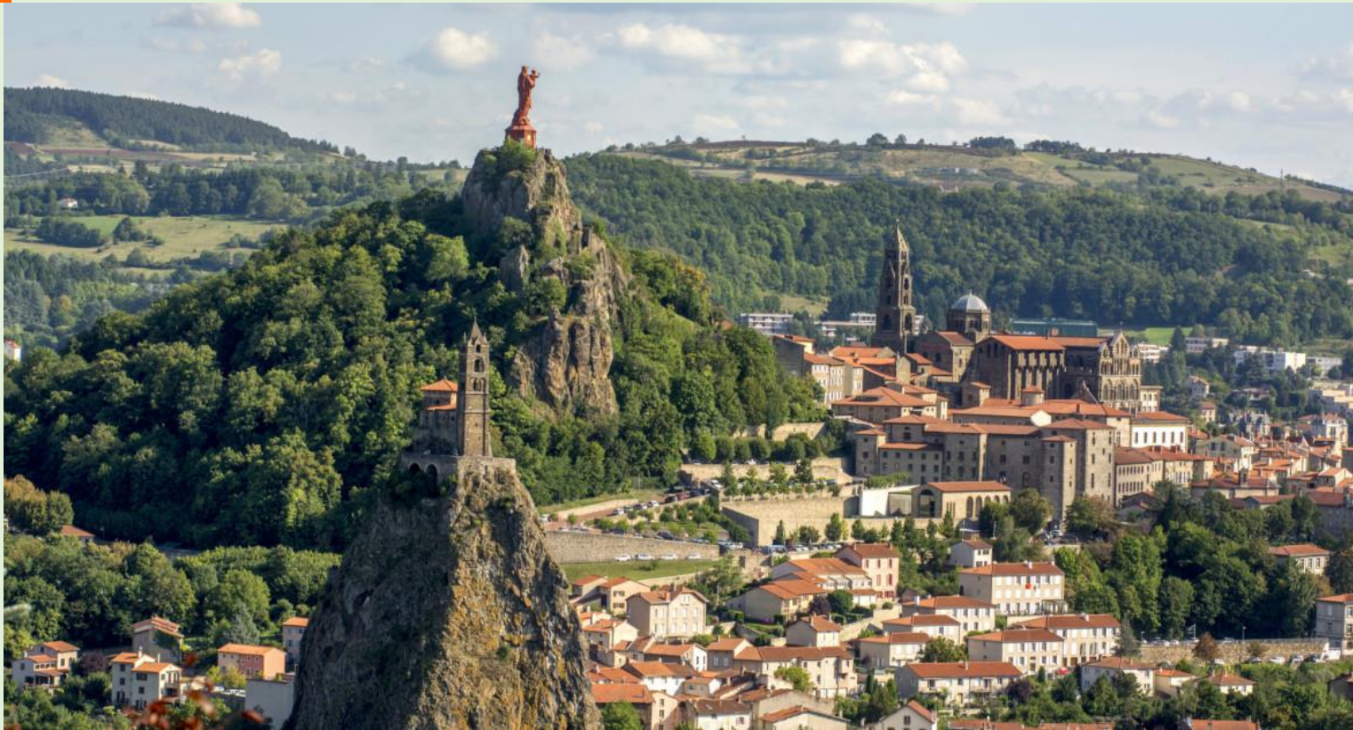
Le Puy-en-Velay, Auvergne-Rhône-Alpes, France

Ary matetika dia manana fahafahana hiaina ity Fitsimbinana Tsara an'Andriamanitra ity aho, ka afaka manao asa soa amin'ireo olona sahirana araka izay zavatra ilainy, indrindra rehefa mitondra ny Hazofijaliana aho.