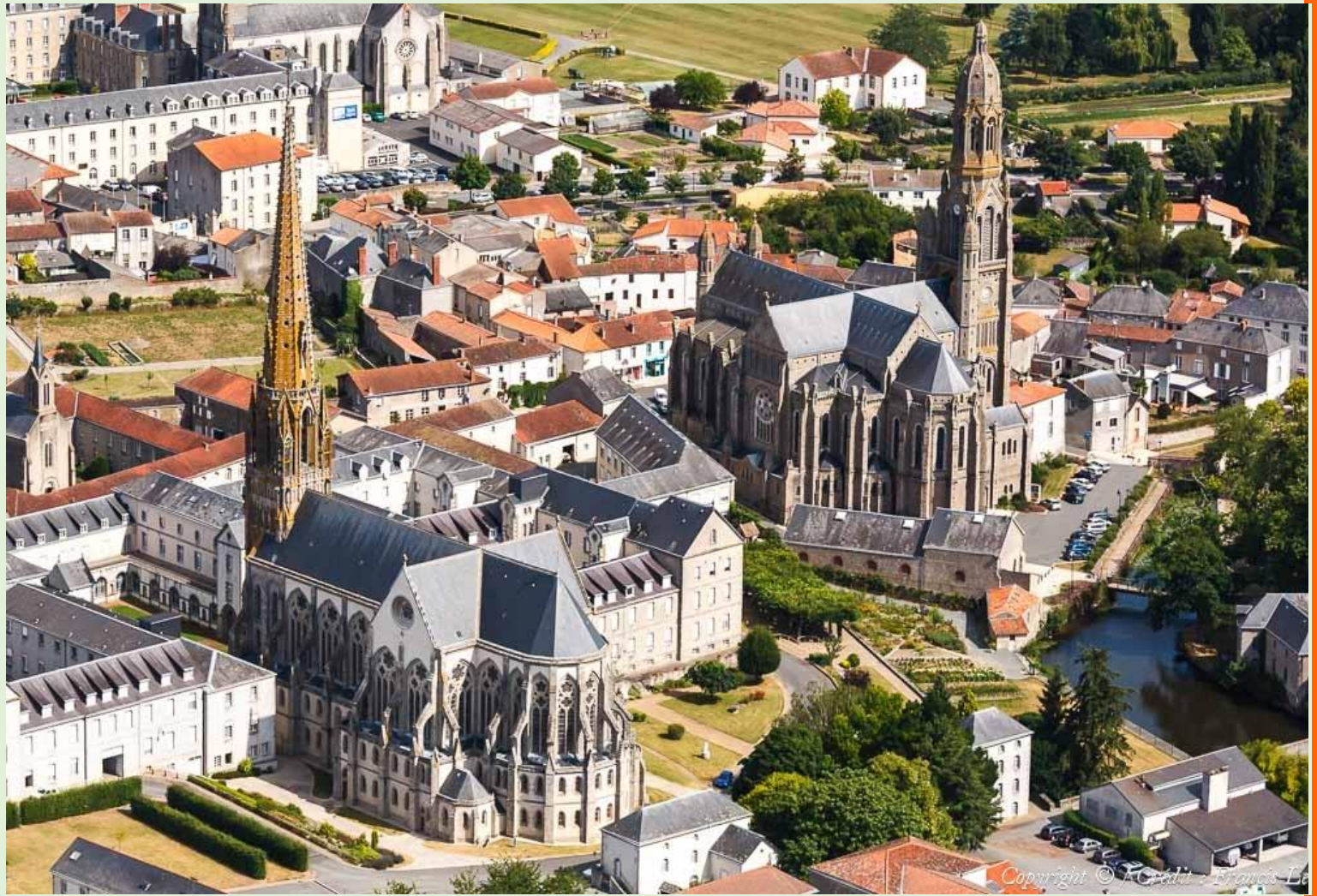
Saint Laurent-sur-Sèvre, Vendée, France

Farany, ny trano nipetrahana dia tsy lavitra fa dimy minitra miala eo amin'ny Katedraly, nisy ny fifandraisana tao mba ahafahana miaina sy mandrindra ny asa, ary izany dia tanaty fiadanana sy hafaliam-po ; ny 30 Avrily 2015, tonga tany Puy niaraka tamin'ny entako aho mba hitoetra any.