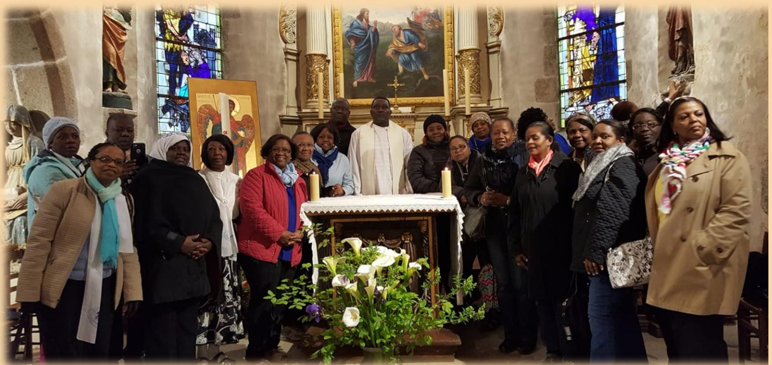
Fankalazana nandritra ny lamesa tany amin'ny Mont Saint-Michel niaraka tamin'ireo Associés

6- Misy fifandraisana tsara mitoetra eo aminay, Montfortanina izay niasa tao amin'ity pastoraly iraka-fianarana ao amin'ny Diosezin'i Rockville Centre ity, izay nitantana ireo Associés sy manohy ny fitarihana azy ireo ho amin'ny lalana marina.