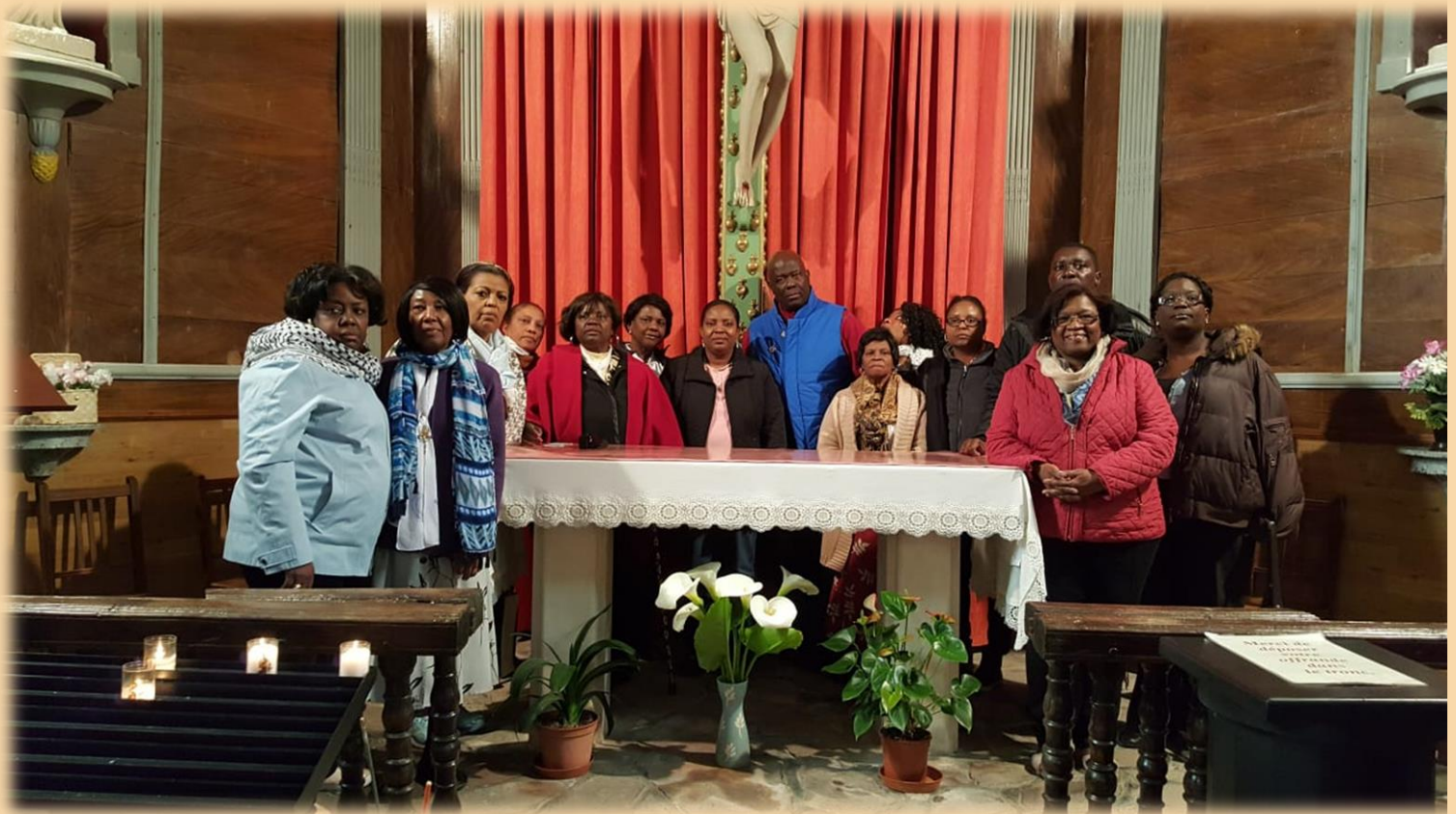
Ireo Associés avy any New York ao amin'ny Lasapely any Pont-Château