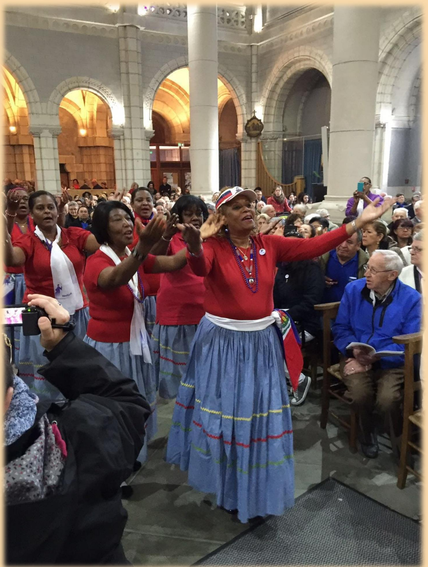
Ireo Associés tamin'ny hiran'ny dia-ben'ny fanolorana nandritra ny lanonana fankalazana ny faha 300 taona nahafatesan'i Père de Montfort tao amin'ny Bazilikan'i St Laurent-sur-Sèvre.