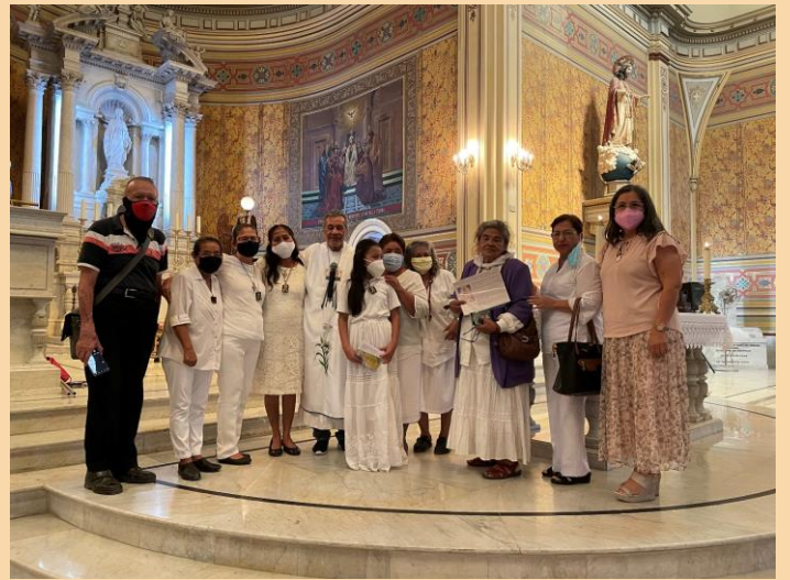
Mompera Jorge Orizaga izay miasa ao amin'ny Katedralin'ny Tampiko ihany koa no nitarika ny Lamesa nandritra ny fanavaozan'ny olona marobe avy amin'ny paroasy samihafa ny fanokanan-tenan'izy ireo.