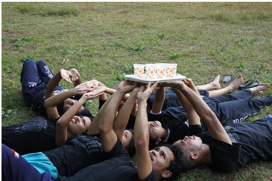
Ny anaran'ity vondrona ity dia TANORA MONTFORTANA . Ny mpikambana dia avy amin'ireo Anjerimanontolo samihafa ao Malang