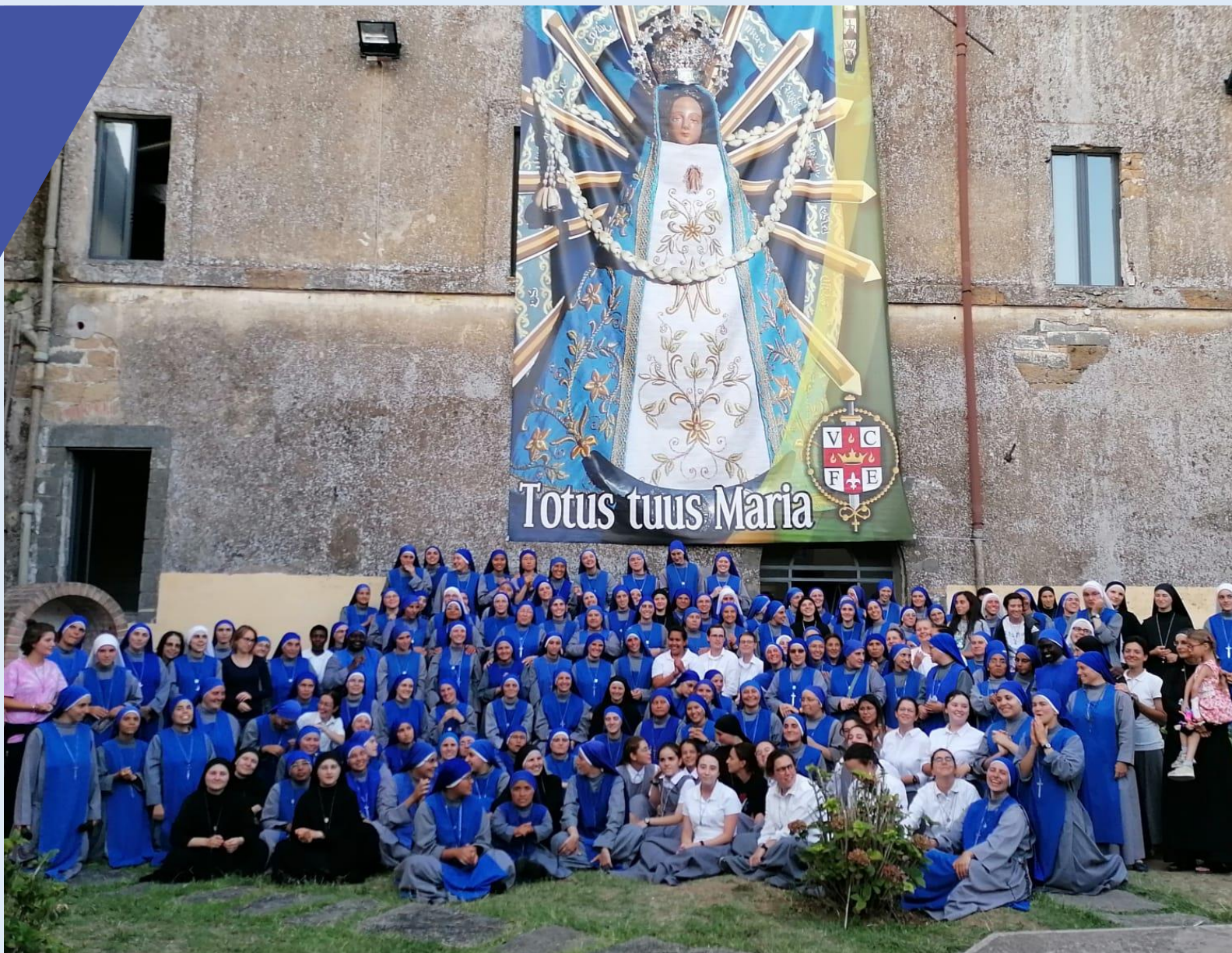
Ambiente en una casa de formación (Bagnoregio, Italia)

¿Cómo vivir concretamente estos propósitos? La vida de Montfort, enteramente centrada en “Dios Solo”, puede traer una gran luz sobre esta cuestión. ■