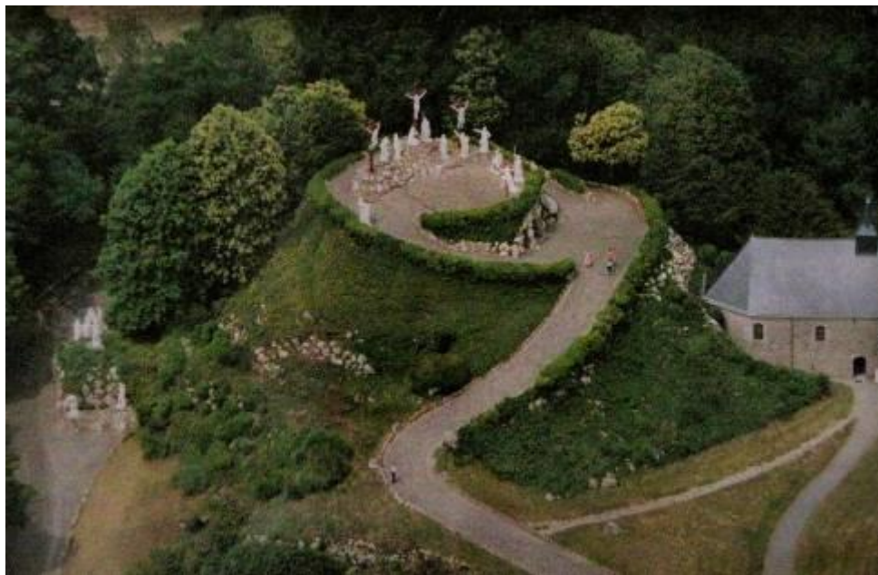
Calvaire actuel à vol d'oiseau