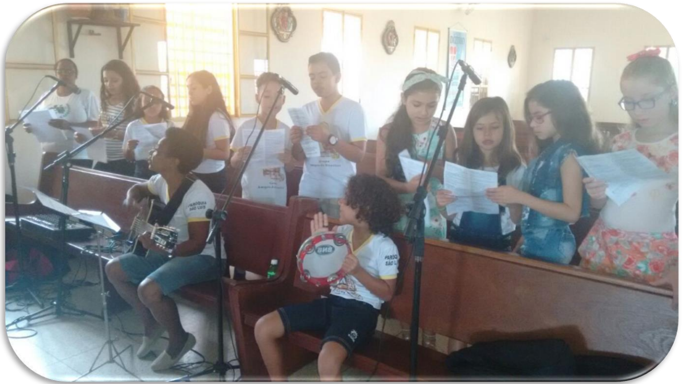
Ny asa ataon'izy ireo dia ny fihirana any am-piangonana (Chorale). Any amin'ny paroasy Nossa Senhora da Penha sy Sao Luis Maria de Montfort, izay misy azy ireo no ihirany.