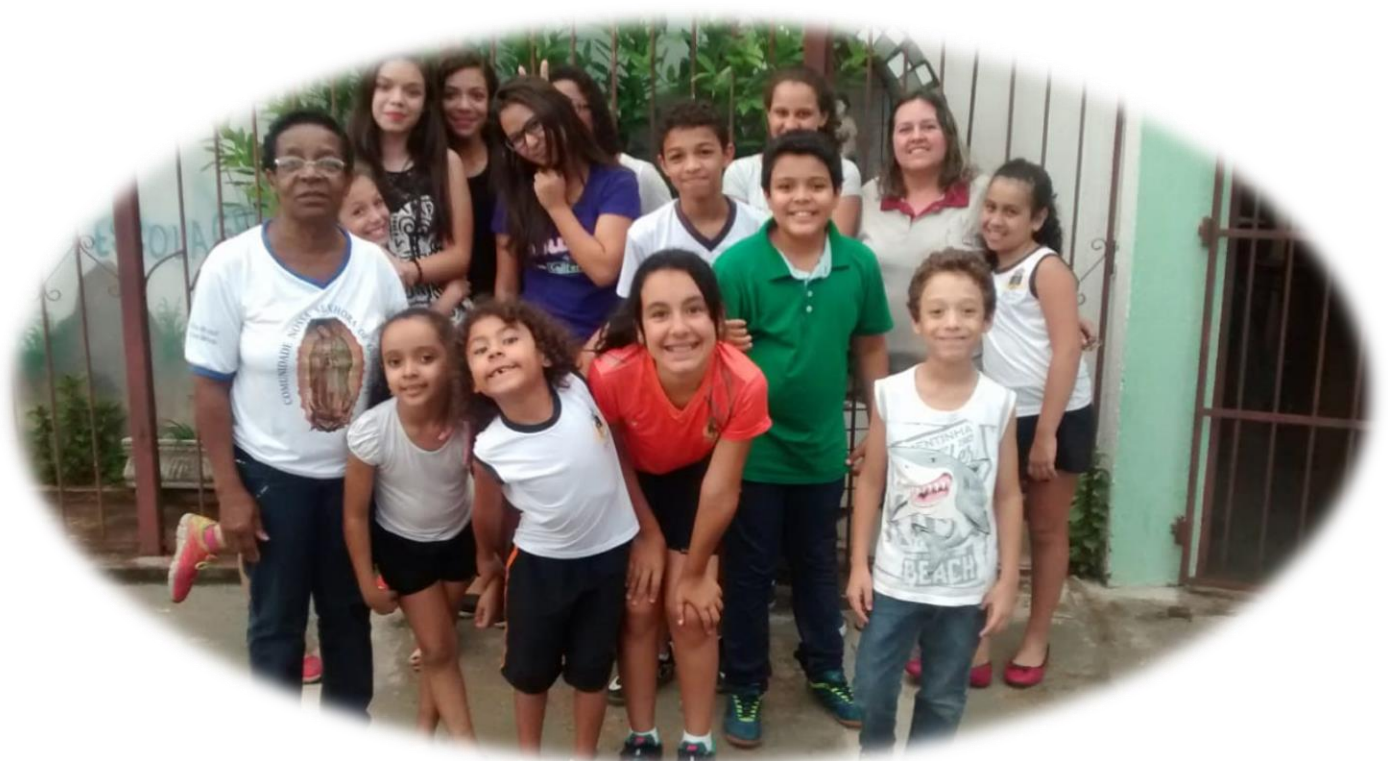
Manao seho an-tsehatra koa izy ireo (teatra), miventy ny Vavaka Fanomezam-boninahitra an'i Masina Maria ary manao saple. (Adriana Orlandi)