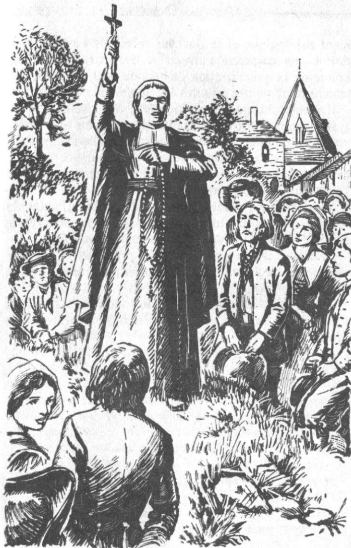
Montfort prêchant une Mission.

De cette spiritualité l'élément premier, la vraie dévotion à la Très Sainte Vierge, a surtout fait école. Il est manifeste que depuis la découverte du manuscrit en 1842 il a fortement marqué la sainteté des âmes, l'enseigne-