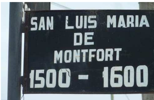
Rue St Louis-Marie de Montfort N.D. de Lujan

En 2016, l'Argentine fêtera les 50 ans de la présence montfortaine.