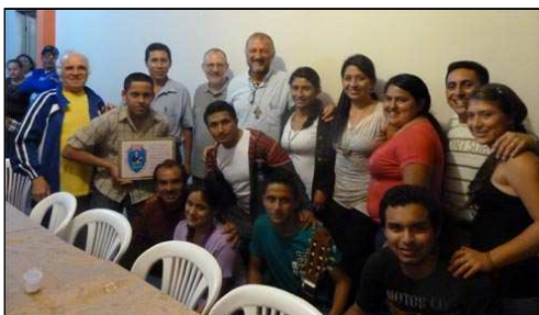
Groupe de jeunes de Buenavista

Mardi 5, le matin, visite du reste de la Zone et en fin d'après-midi présentation de tous les groupes qui travaillent sur le secteur : Les