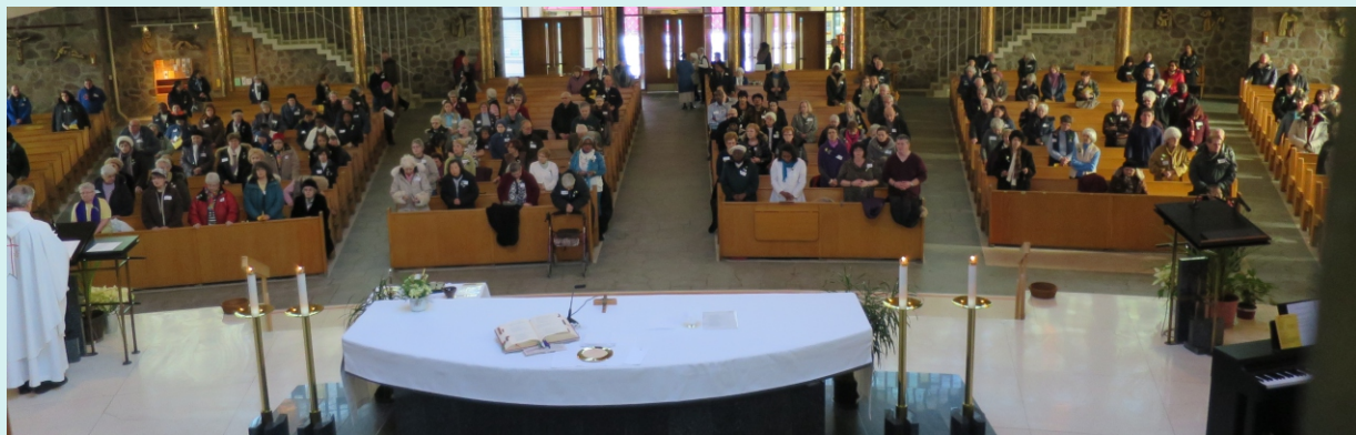
Les 4 membres de l'ASMAD présents