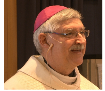
Homélie de Mgr Gazaille

Syméon fait la rencontre avec la lumière de Dieu. La joie l'envahit complètement. Le chrétien baptisé fait aussi cette rencontre et certains parmi eux reçoivent un appel tout à fait spécial pour suivre Jésus de plus près. Cela se vit par les 3 vœux Chasteté, pauvreté, obéissance.