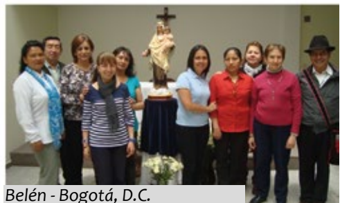
Belén - Bogotá, D.C.