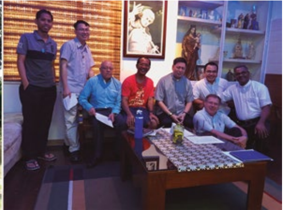
Equipo de exploración fundación Vietnam