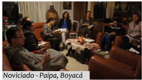
Noviciado - Paipa, Boyacá