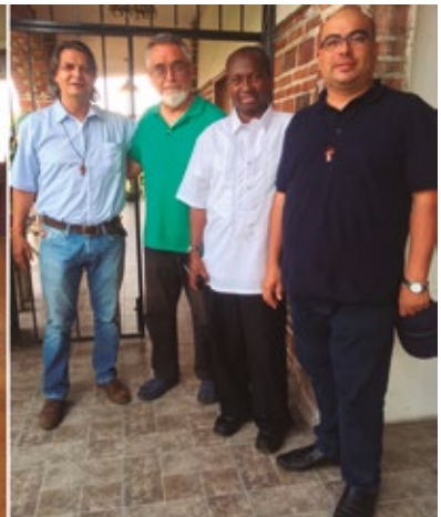
Equipo de exploración fundación México