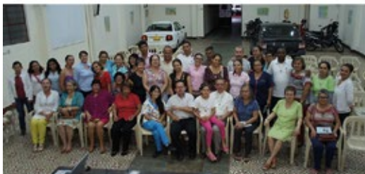
El Carmén - Acacias, Meta