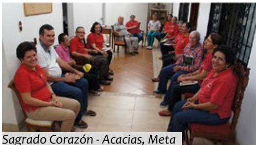
Sagrado Corazón - Acacias, Meta