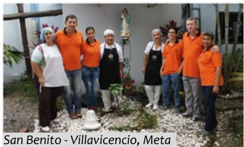
San Benito - Villavicencio, Meta