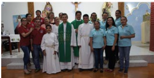
San José Obrero - Puerto Gaitán, Meta