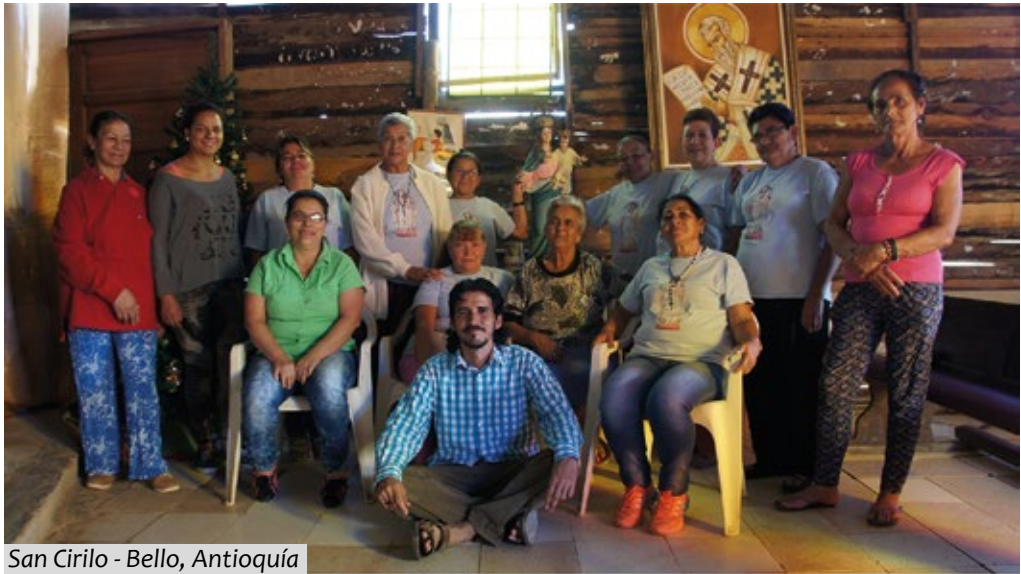
San Cirilo - Bello, Antioquía