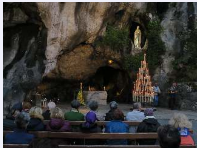
La Grotte de Lourdes où la Vierge est apparue à Bernadette Soubirous, en 1858.