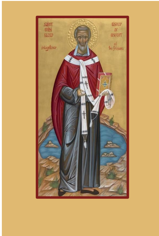
Icon: H. Willibrord