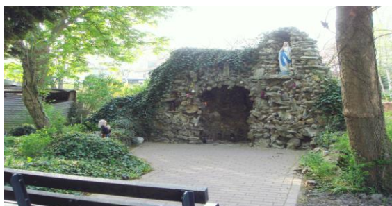
Piet Derckx smm

Ook de Lourdesgrot ziet er netjes uit. Je kunt er een kaarsje opsteken en rustig op de bank zitten om een gebedje te doen. Een wandeling door het park is echt de moeite waard. Ik hoor dat sommigen het mooi vinden en anderen toch liever wandelen in een park met struiken zonder vergezichten. Kom maar eens kijken naar de vele veranderingen. Je bent welkom!!