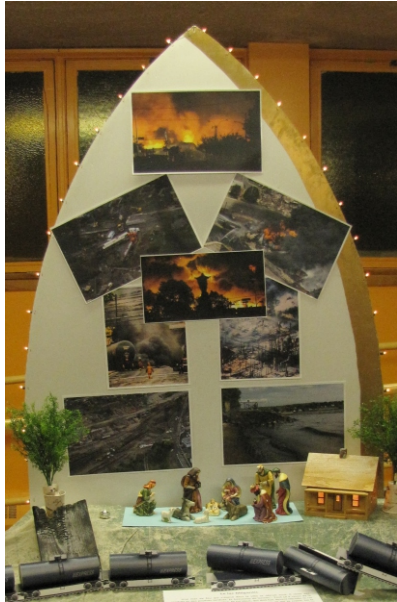
Crèche évoquant le drame du Lac Mégantic