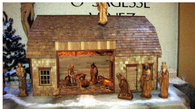
Une crèche inuit côtoyant une crèche québécoise