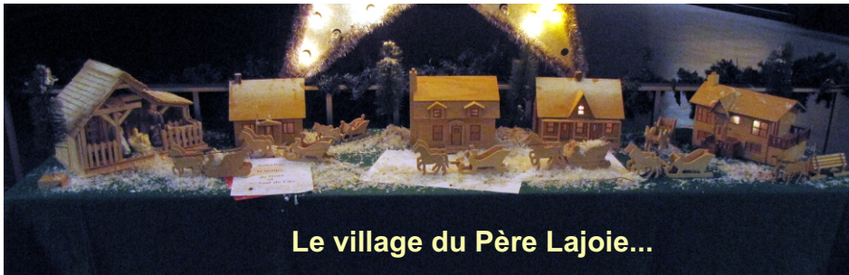
Le village du Père Lajoie...

Sur les ogives, quatre événements sont évoqués: le Lac Mégantic, le typhon aux Philippines, la charte des valeurs, et, tout au fond, le pont Champlain!